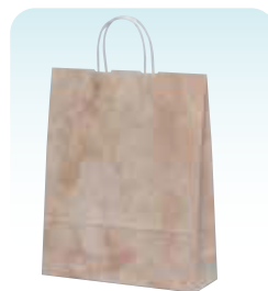
HZ ルネッサンスサーモン