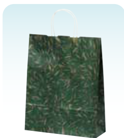
HZ 風雅 グリーン