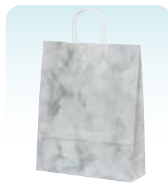
HZ ルネッサンスグレー