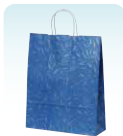
HZ 風雅 ブルー