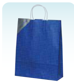
HZ ネット ブルー