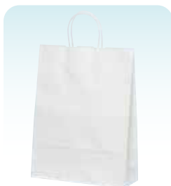
HZ 晒 無地