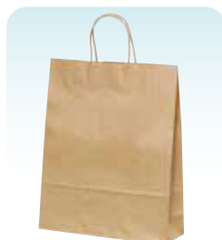
HZ 未晒 無地